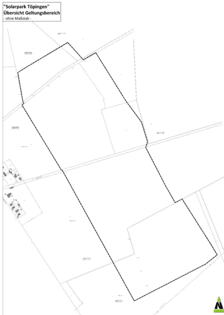
Abbildung 3: Geltungsbereich des Bebauungsplanes