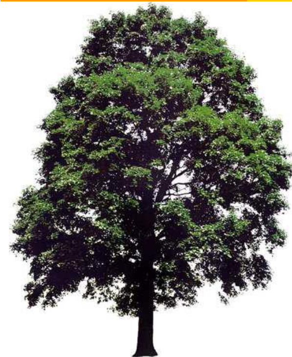
Jubiläumswald „Auf dem Horn“ -Information-