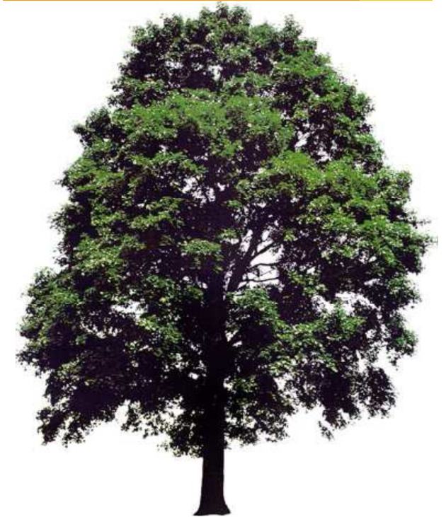
Jubiläumswald „Auf dem Horn“ -Information-