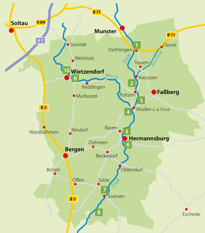
Kulturraum Oberes Örtzetal

Über Rad- und Fußwege sind alle Kunstwerke zum „Skulpturenweg Wasserkunst“ miteinander verbunden und dokumentieren so den Zusammenhalt und das Gemeinsame dieser Region. Einheimische und Besucher können über den „Skulpturenweg Wasserkunst“ den Kulturraumes Oberes Örtzetal auf besondere Weise erleben.